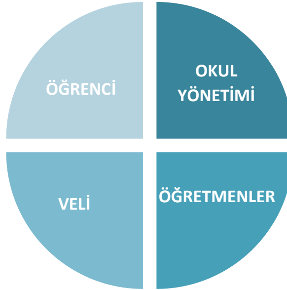
Şekil 1: Okul Temel Paydaşları

Stratejik Planlama sürecinde katılımcılığa önem veren kurumumuz tüm paydaşların görüş, talep, öneri ve desteklerinin stratejik planlama sürecine dâhil edilmesini hedeflemiştir. Bu kapsamda okulumuz, faaliyetleriyle ilgili sunulan hizmetlere ilişkin memnuniyetlerin saptanması, kuruma ilişkin beklentiler, kuruma ilişkin durum tespiti, kurumsal iş birliği ve eşgüdüm, GZFT, önerilerin tespiti vb. konular hakkında Hüseyinmescit Ortaokulu Stratejik Planlama Ekibi ile toplantılar düzenlenmiş ve kurumumuzun temel paydaşları olan öğrenci, veli ve öğretmenlerin görüş ve önerilerini almak üzere görüşme ve anket yöntemi uygulanmıştır.